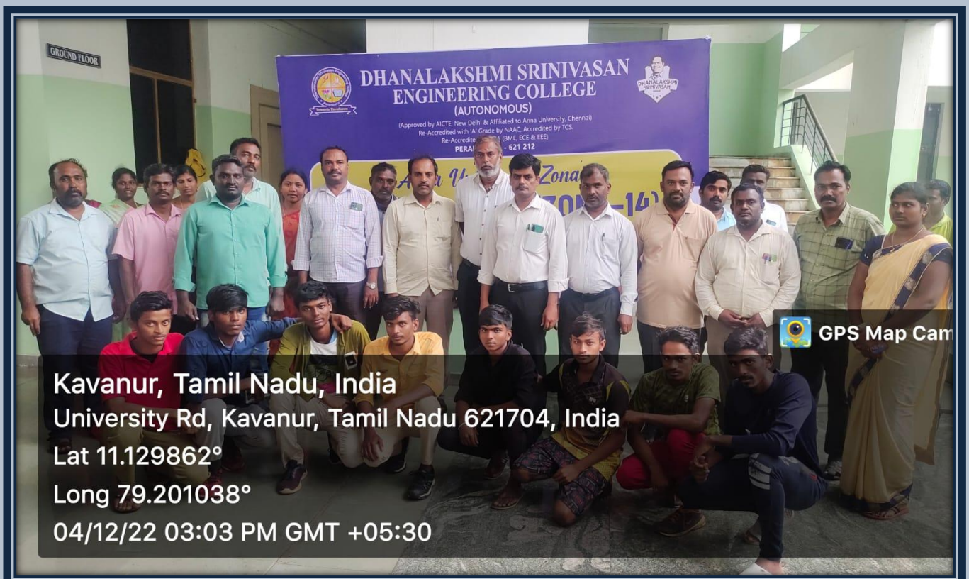
ANNA UNIVERSITY ZONAL LEVEL – ATHELETS (2022 - 23)