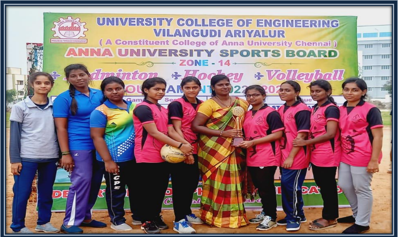
ANNA UNIVERSITY ZONAL LEVEL - VOLLEYBALL RUNNER (2022 - 23)