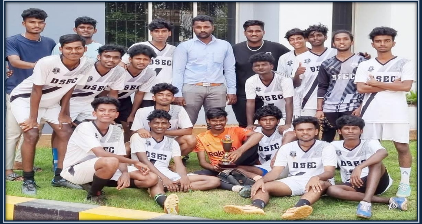
ANNA UNIVERSITY ZONAL LEVEL - FOOTBALL WINNER (2021 - 22)