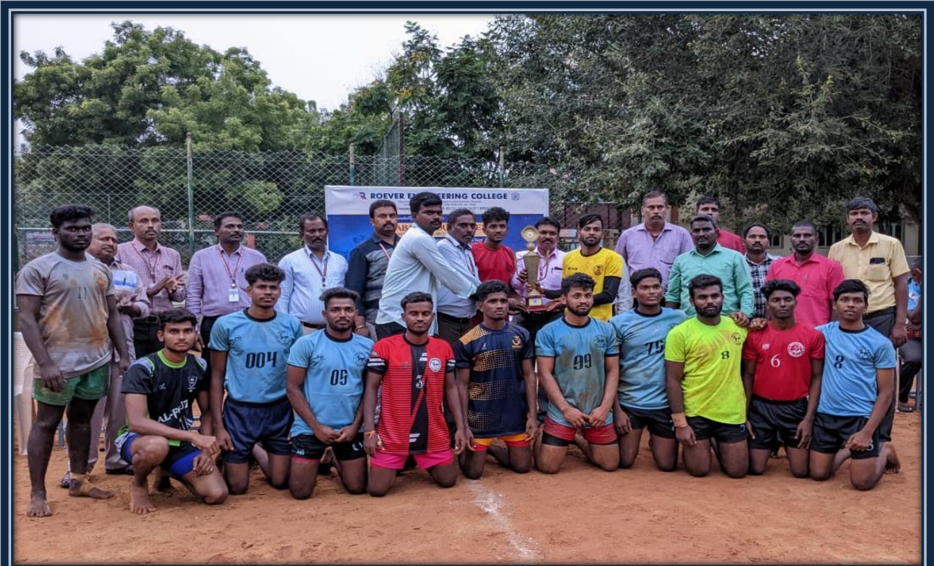
ANNA UNIVERSITY ZONAL LEVEL - KABBADI WINNER (2022 - 23)