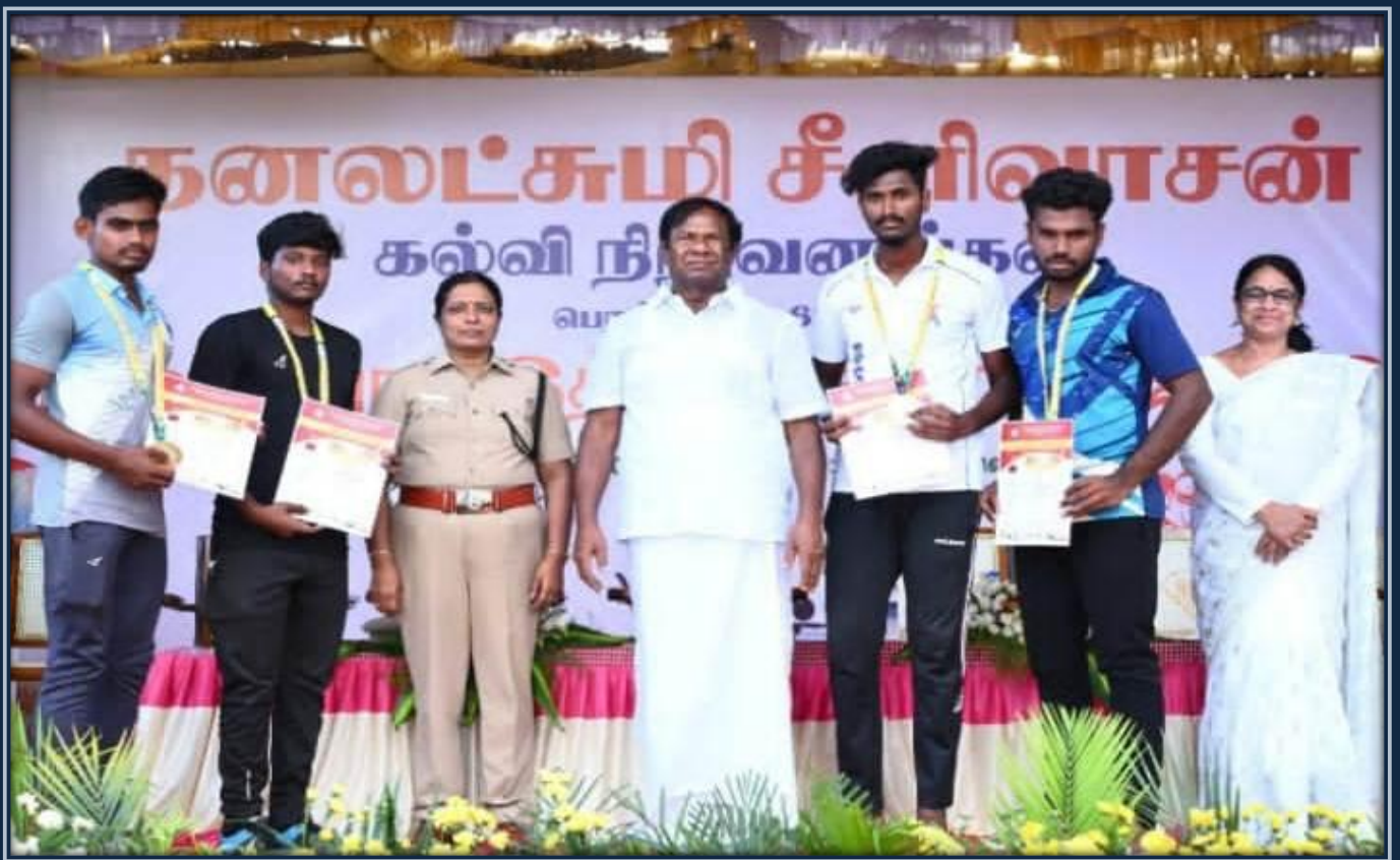
DSEC INTER COLLEGE LEVEL - ATHELETICS WINNER (2021 - 22)