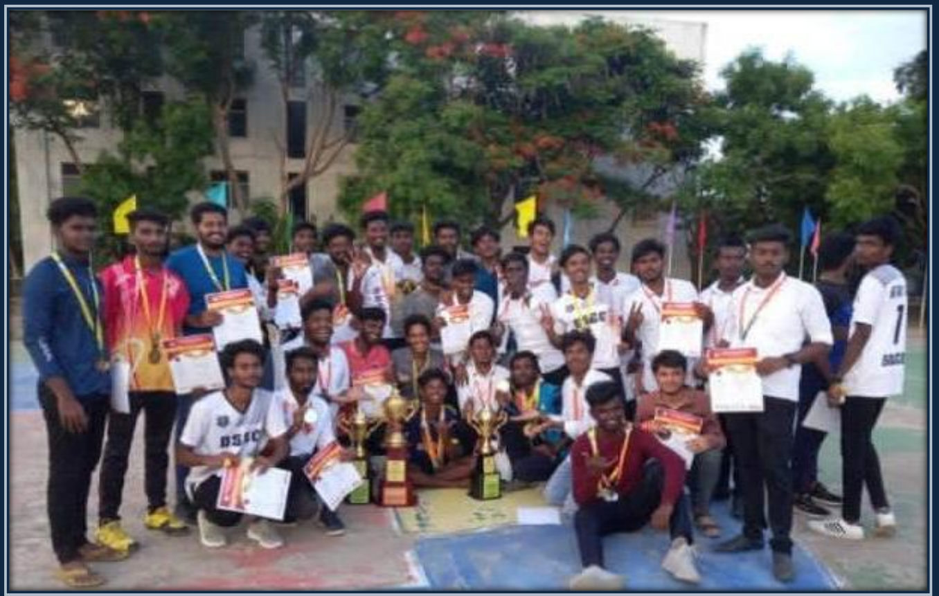
DSEC INTER COLLEGE - CRICKET WINNER (2021 - 22)