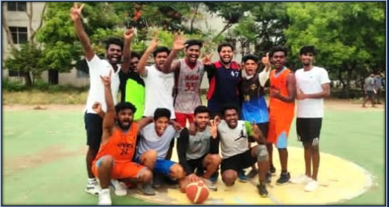
DSEC INTER COLLEGE – BASKETBALL WINNER (2021 – 22)