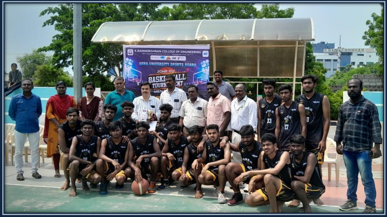
ANNA UNIVERSITY ZONAL LEVEL - BASKETBALL RUNNER (2022 - 23)